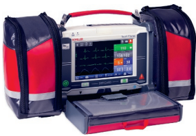
Option interconnexion multiparamétrique incluse dans la licence Nomadtec. Dispositif médical revendu par le constructeur.