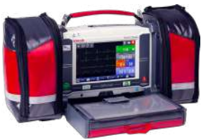
Option interconnexion multiparamétrique incluse dans la licence Nomadec. Dispositif médical revendu par le constructeur.