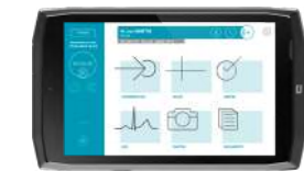
android Windows 10